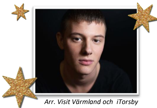
Arr. Visit Värmland och iTorsby